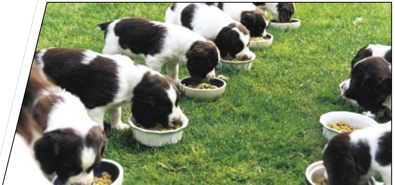
“Zufriedene Kunden durch individuelle Betreuung”

Wenn dieses Szenario auf Sie zutrifft, bietet Ihnen factline eine bezugsfertige Lösung, die sich problemlos in bestehende Webkonzepte integrieren läßt - die factline Kundenplattform .